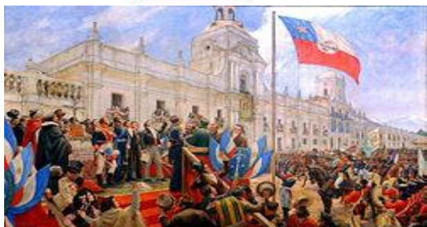
Estado de avance: evaluación formativa Historia y Geografía 6° Básicos.

Queridos estudiantes de Quinto básico, el día de hoy realizaremos la 2da evaluación formativa de la asignatura, correspondiente a la segunda Unidad, los viajes de exploración y conquista hacia América y otros territorios.