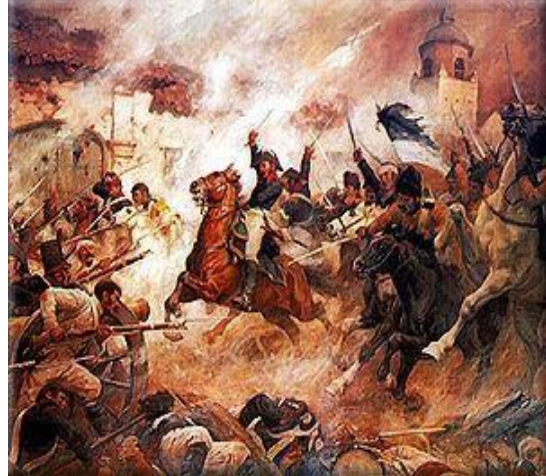
Carga de O'Higgins en la Batalla de Rancagua, óleo de Pedro Subercaseaux.

Primeros símbolos patrios del periodo Patria Vieja, en el Gobierno de José Miguel Carrera